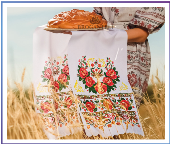
BRO-308R-O BRO-308R-OS Рушник Орнамент «Венец из роз» (красный)